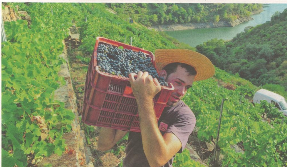
Recogida de uva de mencia, en la jornada de ayer, para una de las bodegas de la subzona de Amandi que abrieron la vendimia. ROI FERNÁNDEZ