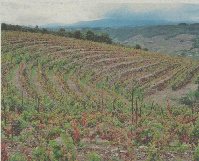
Dieciséis hectáreas. Ponte da Boga acondicionó una amplia plantación de viñedo en la parroquia de San Vitorio, en el municipio de O Saviñao, que será vendimiada en los próximos días. ROI FERNÁNDEZ

Las dieciséis hectáreas de San Vitorio están plantadas con diferentes variedades tintas y blancas. La bodega está muy satisfecha de los primeros resultados, que en el caso del albariño supe-